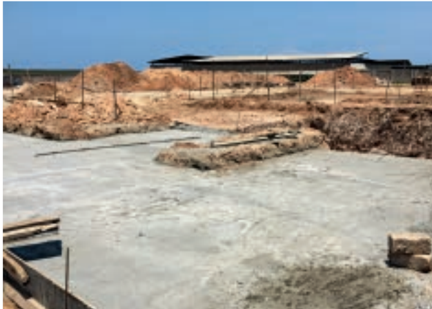
Préparation du site par le client