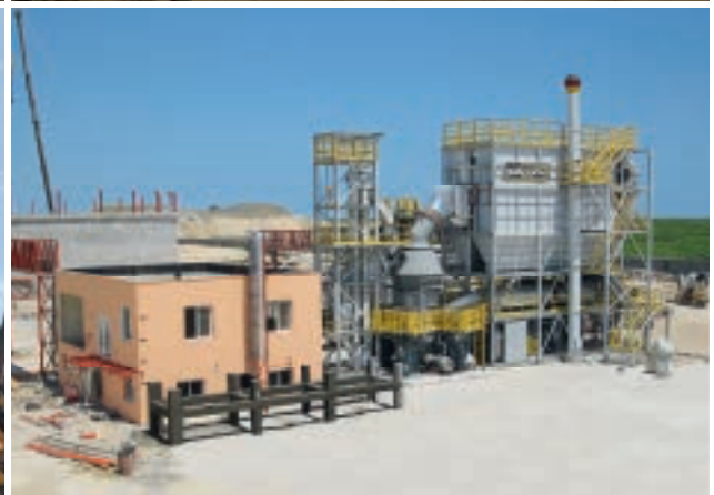
Fin de montage après 2 mois