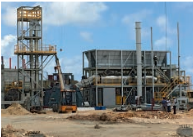
En cours de construction