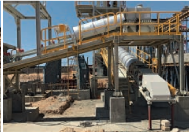
Début de montage