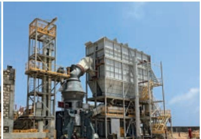
En cours d'achèvement